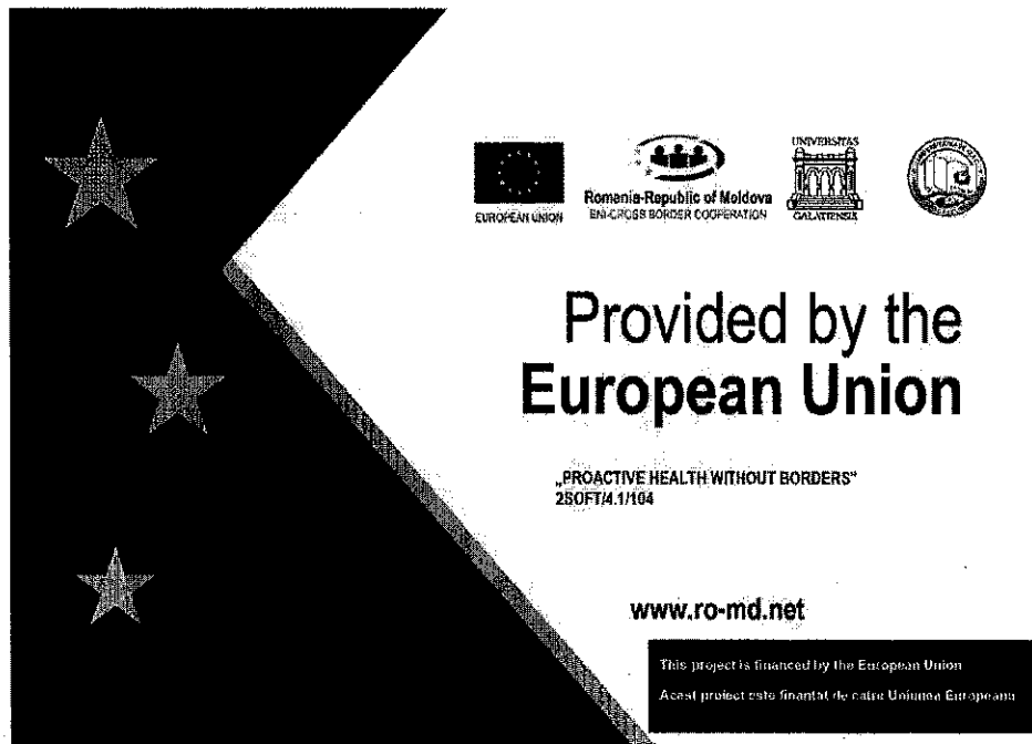
Fig1: Plăcuță metalică personalizată

I. Furnizorul trebuie să asigure realizarea și furnizarea a 80 de plăcuțe metalice informative cu respectarea identității vizuale aprobate de Autoritatea de management - (Fig. 1)