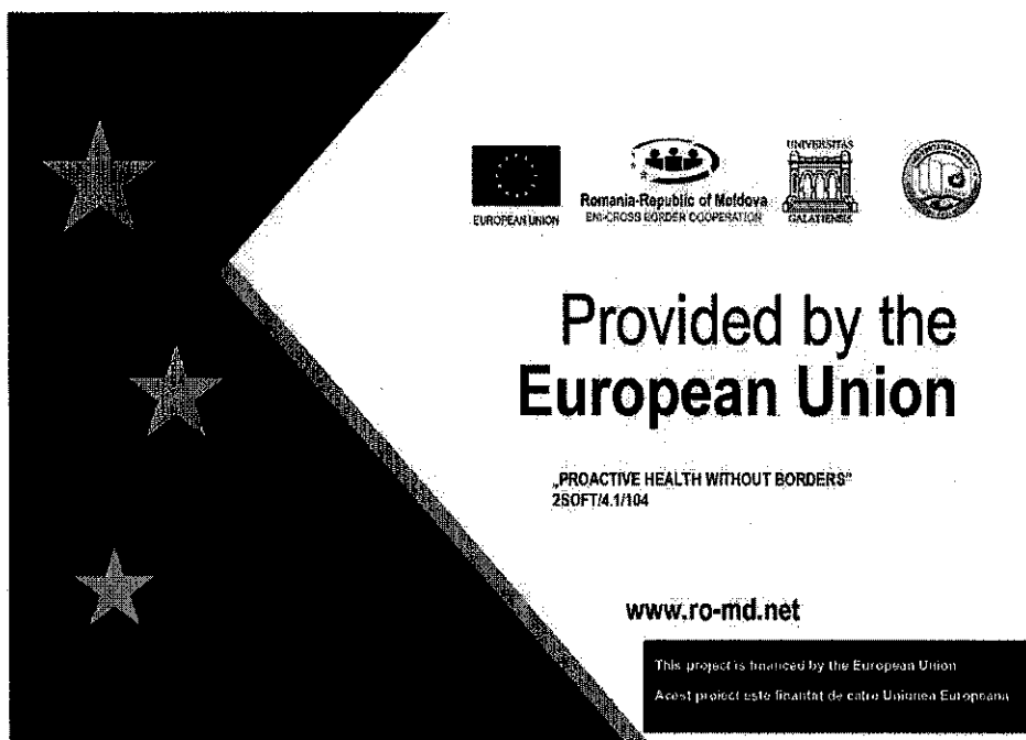
Fig1: Plăcuță metalică personalizată

I. Furnizorul trebuie să asigure realizarea și furnizarea a 80 de plăcuțe metalice informative cu respectarea identității vizuale aprobate de Autoritatea de management - (Fig. 1)